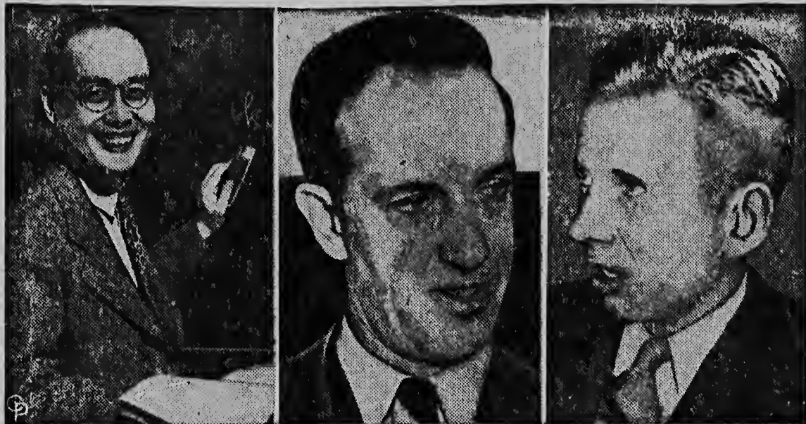
DR. HIDEKI YUKAWA